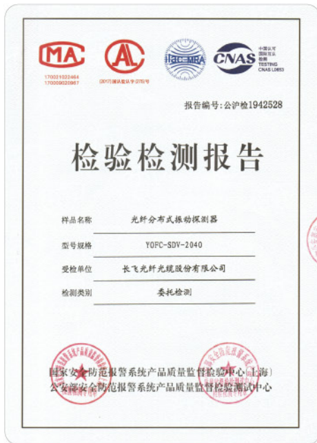
公安三所委托测试报告